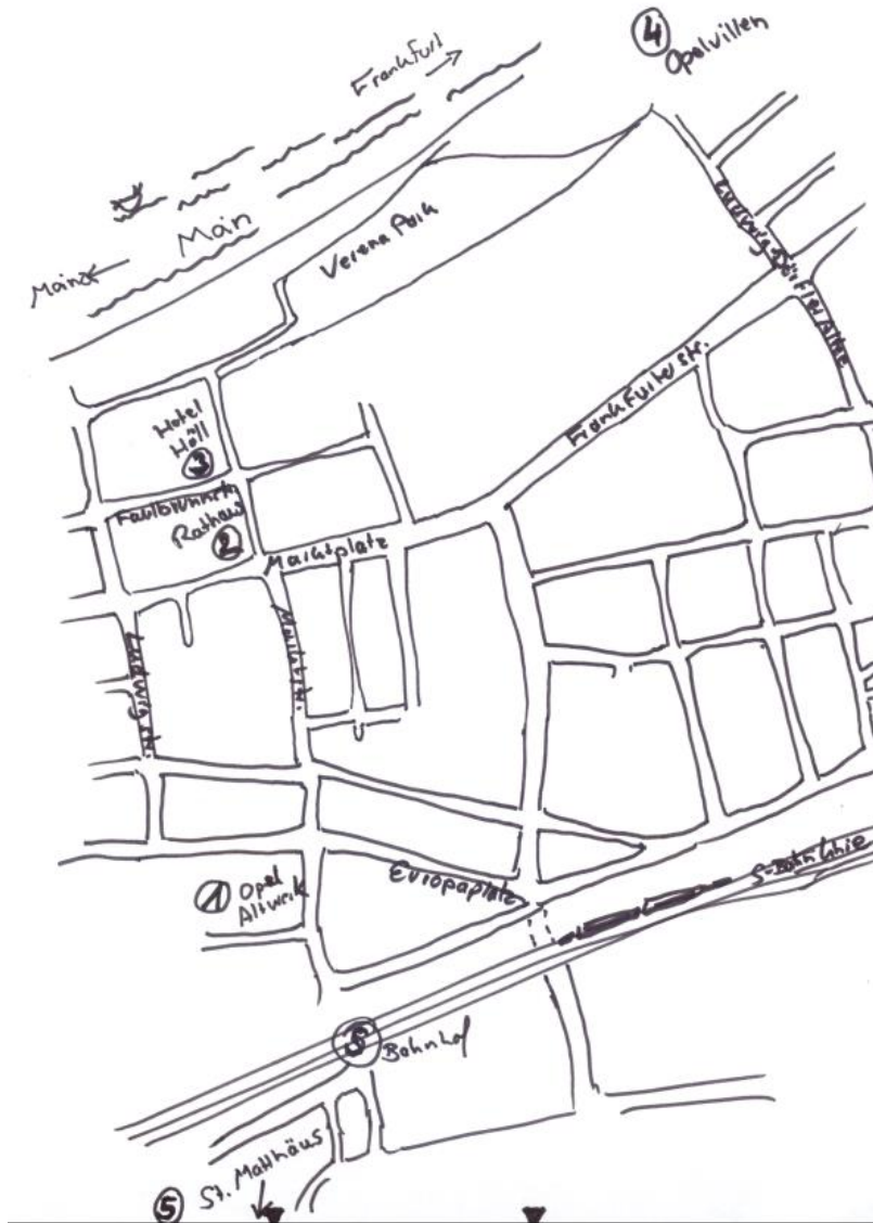
Walk Innenstadt und Opelvillen